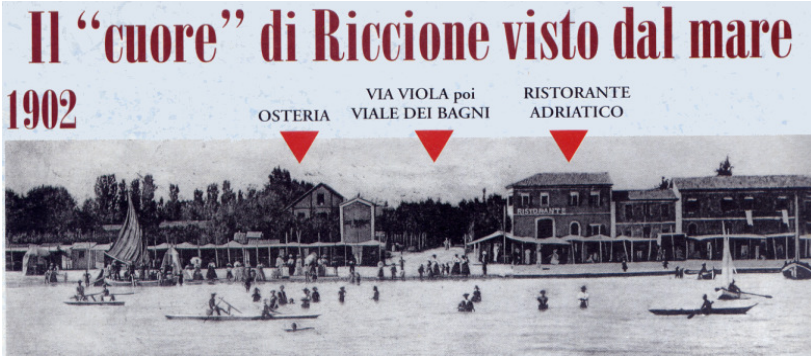
Il Lido quando ancora era una semplice osteria (davanti a sé la garitta dei finanzieri)

Si viveva un vivere semplice, naturale, senza eccessive pretese, anche se Riccione poteva offrire ottimi alberghi di elevata categoria. Non era ancora quel centro balneare che sarebbe diventato negli anni a venire. Oggi una delle più famose spiagge dell'Adriatico.