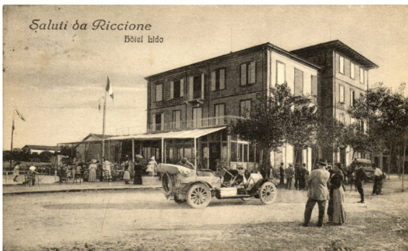
Il Lido negli anni Venti