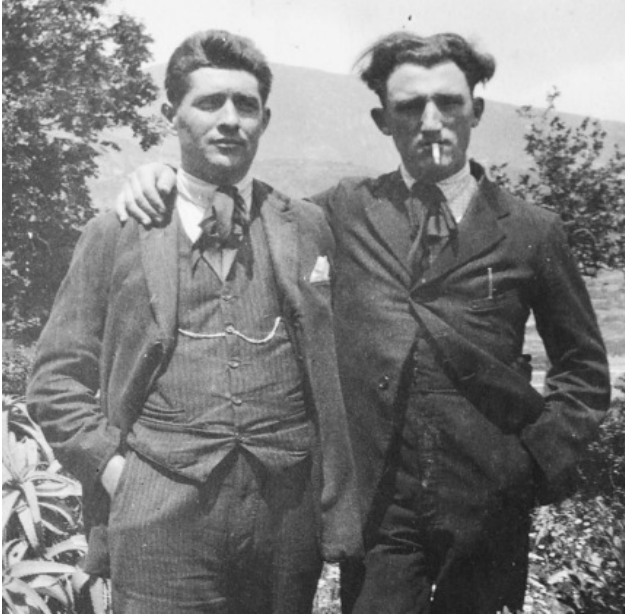
Sandro Pertini e Giovanni Fusconi confinati presso l'isola di Lipari

Alle origini della Giunta del Sindaco Quondamatteo